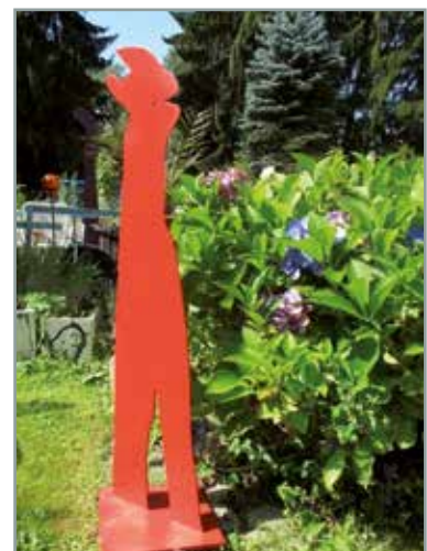
Roter Hase, Ulrike Zilly

und schätzt, wird ihn neu erfahren und anders wahrnehmen, insbesondere durch die noch nie dagewesene temporäre Präsentation der Kunstwerke.