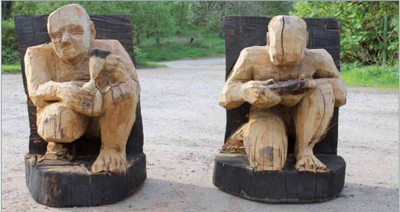
Holzskulpturen von Johannes Löcherbach