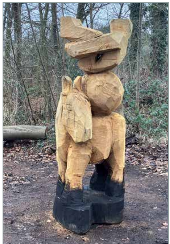
Roger Löcherbach, Hopp, Hopp, Hopp, 2026, Holz