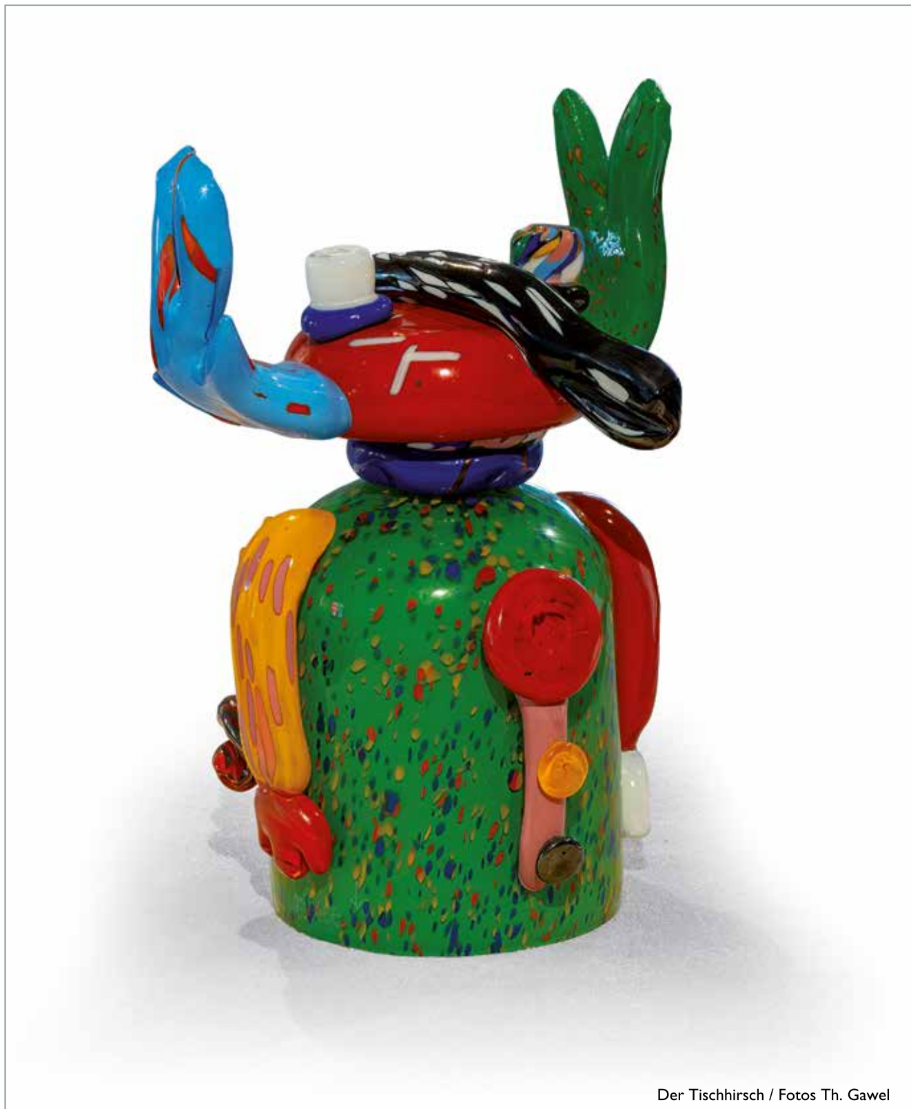
Der Tischhirsch

Die Ausstellung wird von Sonderveranstaltungen begleitet.