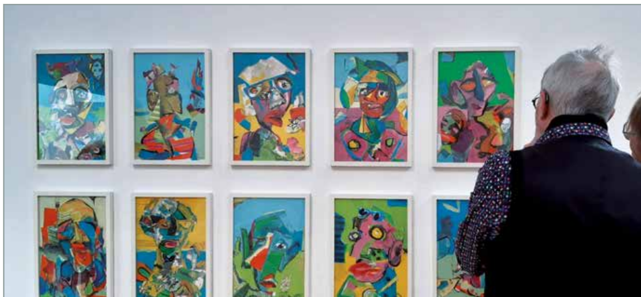
In den großformatigen Bildern gibt es viel zu entdecken