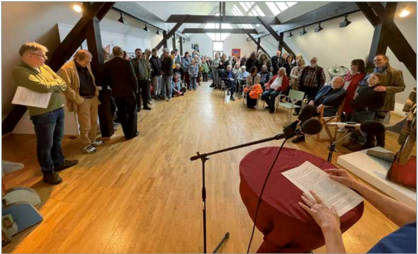
Rund 120 Gäste waren zum Frühlingsempfang gekommen